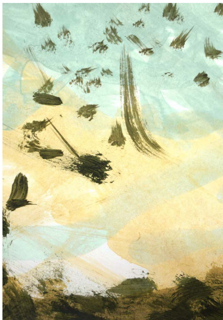
Elmar Schafer, Felsen, 20 x 25 cm, 2016

14-20 septembre 2020 Halle 3, Messe Basel