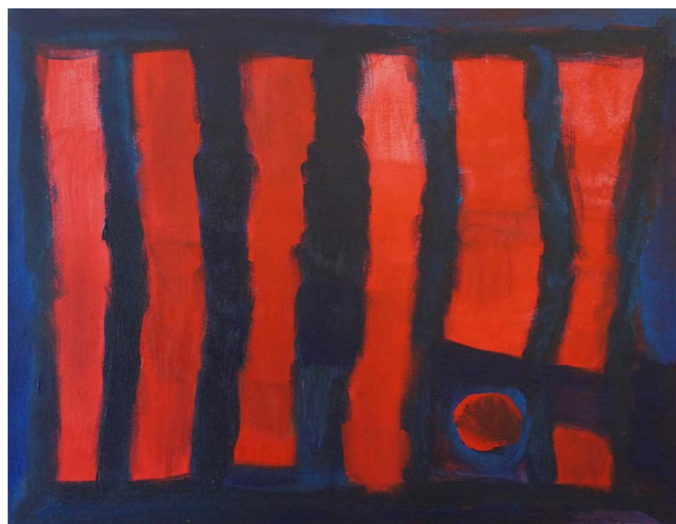
Maude Vonlanthen, Couleurs marines, 54 x 65 cm, 2019